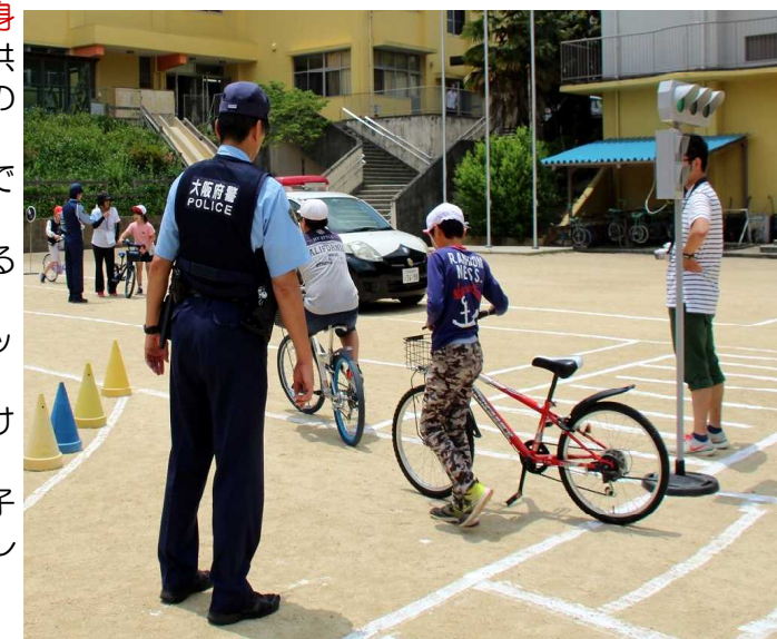
6月5日 交通安全教室

各ご家庭におかれましても、子供たちと安全な生活について話し合っただけであればと思います。