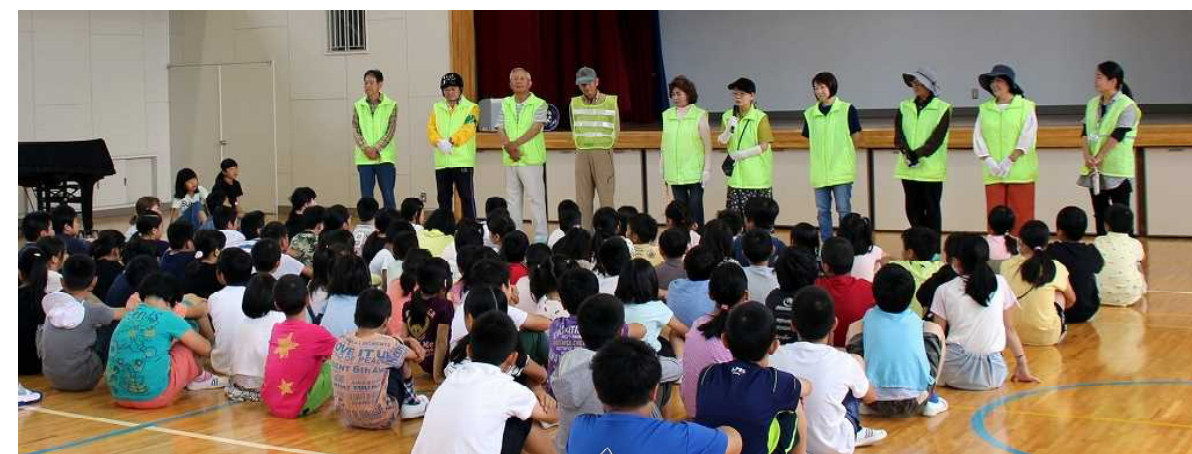
6月18日 朝礼で見守り隊を子供たちに紹介しました