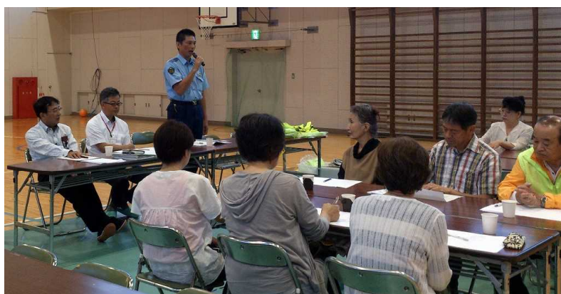
6月10日 学校支援地域本部 見守り隊 総会

方に来ていただいて「交通安全教室」を実施しました。安全な道路の歩き方や安全な自転車の乗り方について、運動場実際に信号機や横断歩道も設置したコースを使っての歩行、走行をしながら体験的に学びました。